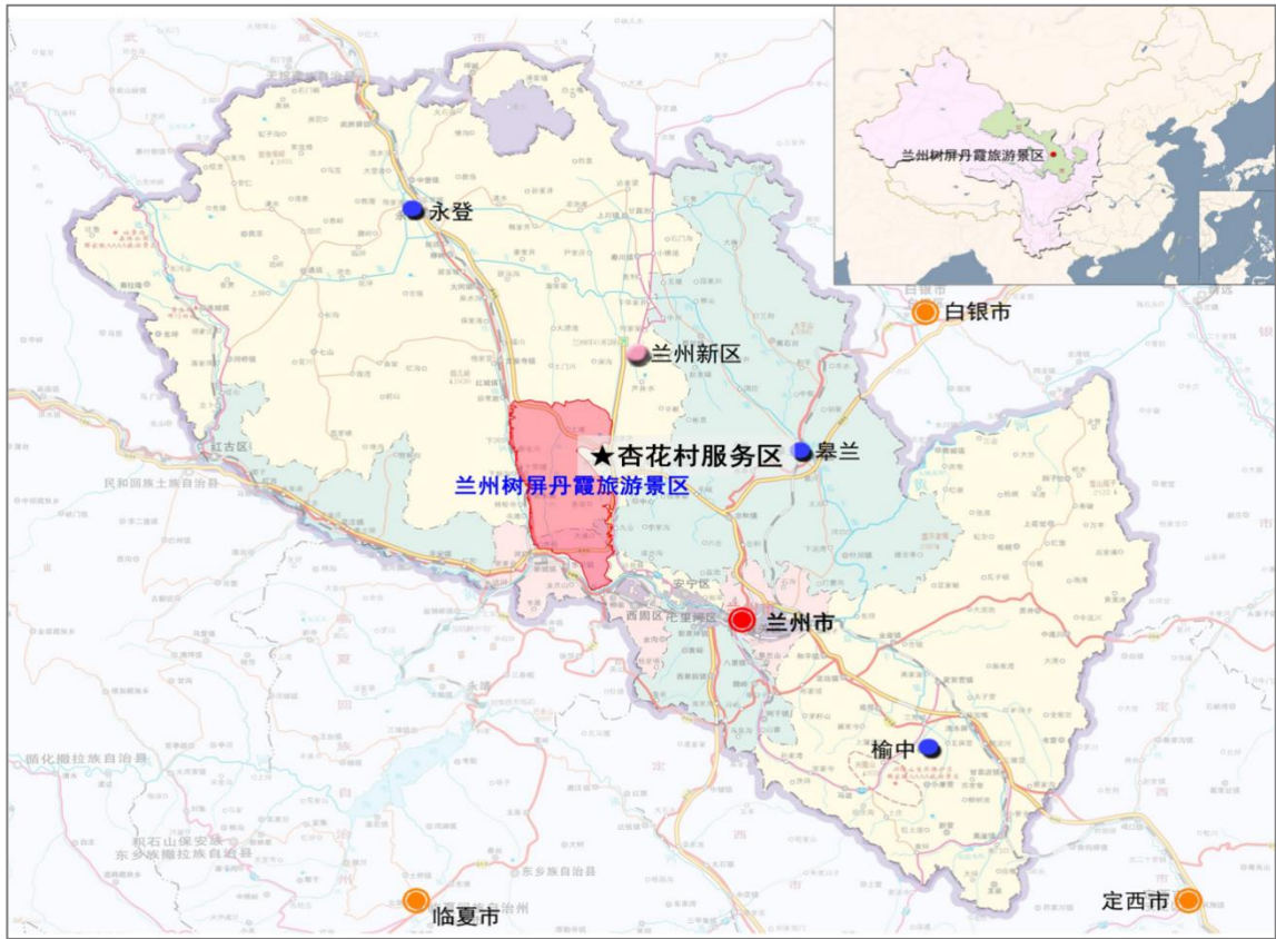
杏花村水墨丹霞主题服务区与兰州水墨丹霞位置关系图