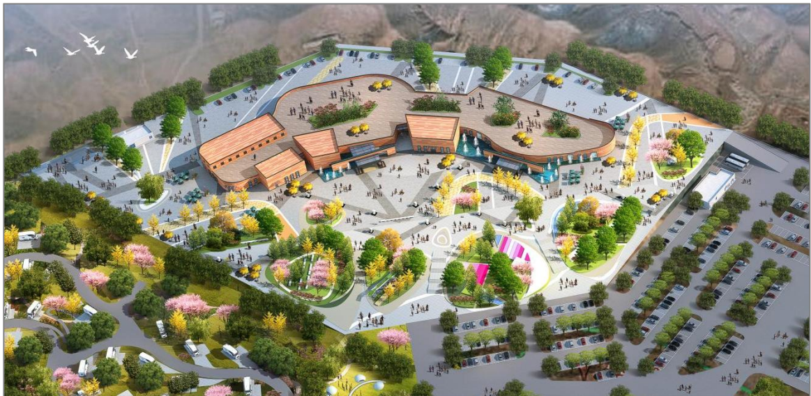
杏花村水墨丹霞主题服务区（西区）鸟瞰图